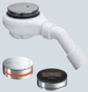
V1 Odtoky pro koupací a sprchové vany Elektronické mísicí jednotky Multiplex Trio E Údaje o použití