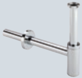
V2 Odtoky pro umyvadla a bidety