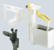
T7 Náhradní díly/odvodňovací příslušenství