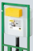
T3 Viega Eco Plus Sanitární prvky pro předstěnovou a stěnovou montáž