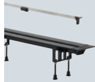
X1 Sprchové žlábký Advantix