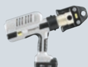
P1 Systémové lisovací nástroje