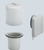
X5 Náhradní díly k systémům Advantix a zápachovým uzávěrům