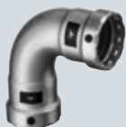
F2 Megapress (Ocel) Technika spojování silnostěnných trubek z oceli lisováním