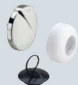
V5 Náhradní díly k zápachovým uzávěrům a odtokovým soupravám