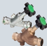
J1 Easytop Systémové armatury z červeného bronzu/nerezi