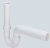
V3 Odtoky pro dřezy, výlevky a přístroje