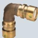
N1 Geopress (Červený bronz) Lisovací spojovací technika pro v zemi ložené PE-HD a PE-X trubky