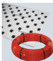
R1 Fonterra - systémy plošného temperování