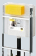
T2 StepTec Stavebnicový systém pro předstěnovou instalaci